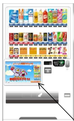
歩数計読み取り機器