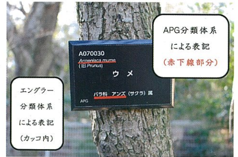
▲エングラー及びAPG分類体系を併記した樹名板

当センターでは、平成27年度から、樹名板の改修に着手しました。新しい樹名板はAPG分類体系とエングラー分類体系を併せて表記しています。樹名板の改修は完了まで5年かかる予定です。職員と、園芸ボランティアの皆さんの協力により進めています。