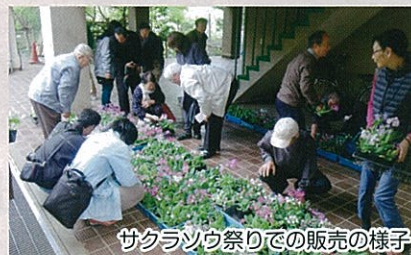
サクラソウ祭りでの販売の様子

当センターでは、サクラソウの園芸品種や野生種386品種・系統の保存を行っています。また、毎年4月の中下旬に開催しているサクラソウ祭りでは、サクラソウ花壇展示や栽培講習会、園内に植栽したサクラソウの花畑をお楽しみいただけます。江戸時代からの続く伝統的な品種を含め、園芸品種の販売も実施しています。