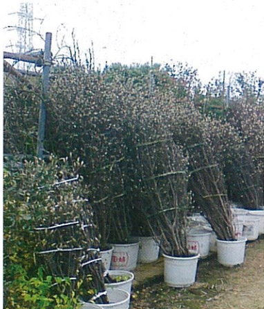
マグノリア類の枝折り▲

春から秋にかけては、ヒマワリ、ケイトウなどの切り花、冬は、サクラ、ハナモモなど伝統的な枝物の生産・販売を行っています。切り花は、水揚げに独自の工夫を加えることによって鮮度を長く保てるようにしています。枝物は、明治から続く「赤山の枝物」の技を駆使し、丁寧な枝折り物づくりに取り組んでいます。枝折りとは、本来輸送中に花や枝が痛まないように編み出された技術ですが、高い技術で枝折られた枝の束は、美しく充分観賞できるものです。