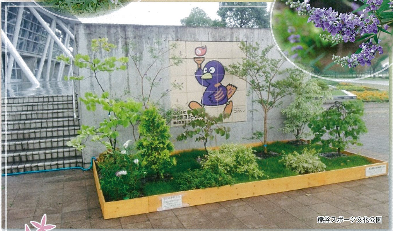
熊谷スポーツ文化公園