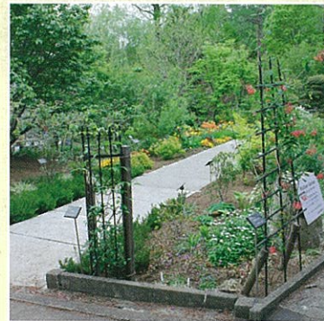
◀夏五輪を想定した Welfare Garden

今後もこれら生産振興対策とともに、APGという新しい分類体系に対応した樹名板整備を進め見本園機能としても一層の充実を図り、皆様に地域により開かれた機関としてあゆみを進めていく所存です。