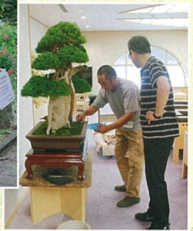
盆栽研による ▶ 埼玉スタ貴賓室での展示