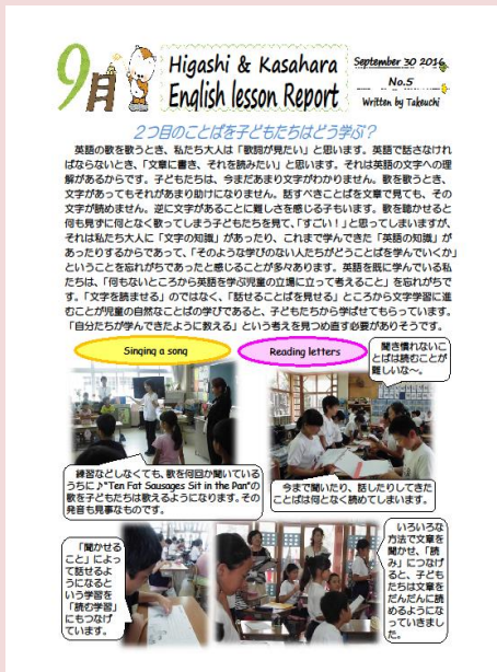
【毎月発行される English Lesson Report】