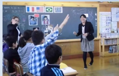
【研究発表会の研究授業】