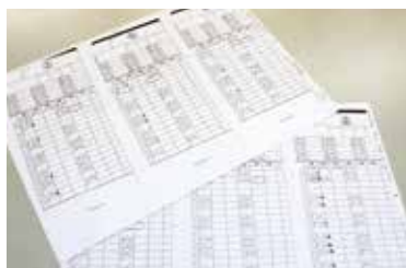
企業ごとに違う計算ルールのため作業時間がかかる。

そこで同事務所ではリタネット事業協同組合に相談し、勤怠データの取り込みから給与ソフトへの入力までを効率化するシステムを導入。顧客ごとのルールに合わせて簡単に集計できるようになり、入力ミスもなくなった。システムはエクセルで構築されているため、誰でも操作可能。何より作業時間が半分に短縮されたことで新たな契約が取り、顧客数は増加したという。念願だったコンサル業務にも注力でき、人事労務全般のサポートを実施し売上増も果たしている。