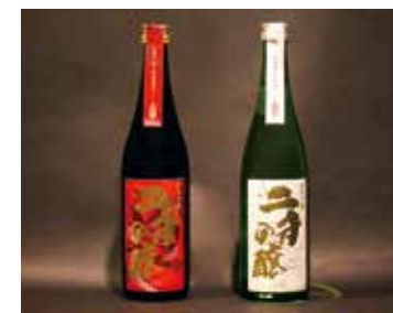
プロジェクトで誕生した大吟醸「ニオの釀(かもし)」。ニオは「若者」という意。

また無料のネットショップサービスを活用し、オンライン販売も開始。年に数件だった注文も月10件以上に。今後は自社だけでなく、全国に年間清酒出荷量全国4位の「酒どころ」埼玉県もPRしていきたいと語る。