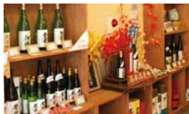
若者の日本酒離れを食い止める方策が必至。

日本酒のメイン層は50～60代、もっと若い世代に日本酒を広めたい、伝統ある純米酒の良さを伝え、手に取ってもらうにはどうしたらいいか…。会社の将来も見据え20代へのアプローチが必要だと考えたのだ。周囲の20代に日本酒を飲まない理由をリサーチした結果、日本酒がそもそも飲む選択肢に入っていないという厳しい現状を知る。まずは日本酒の魅力を周知することが最優先課題となった。