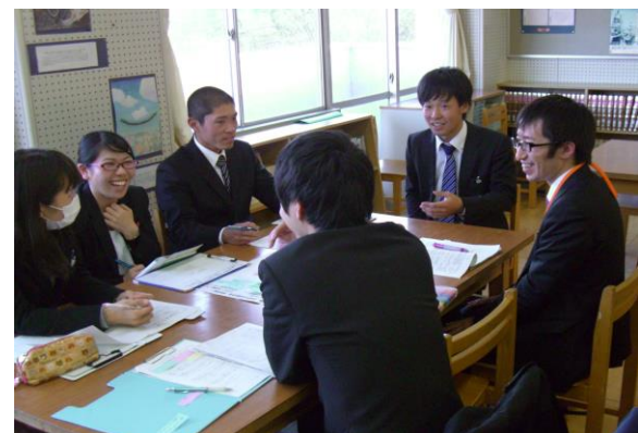
ワークショップ型研究協議