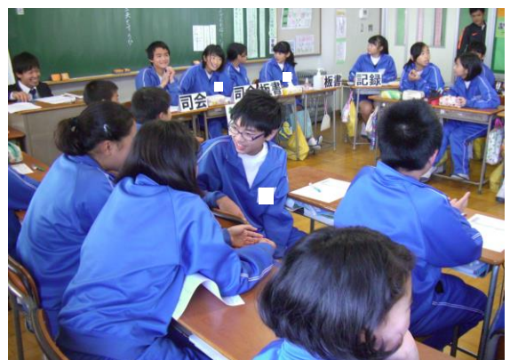
話合いの活性化を図るグループ討議