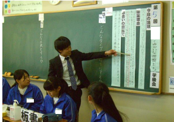
教師による話合いのポイントの確認