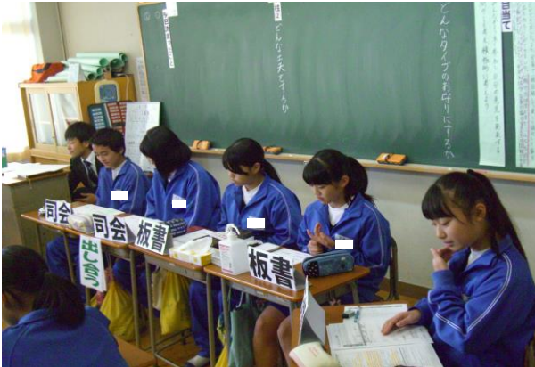
司会グループによる円滑な進行