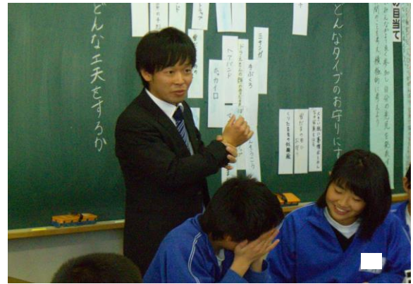
話し合いの方向を修正する適切な助言