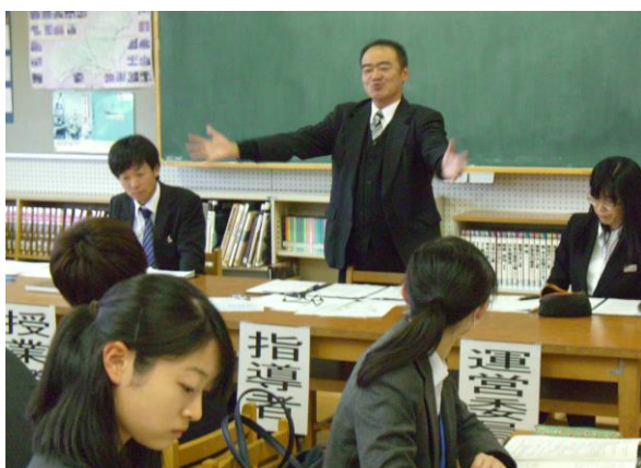
特別活動の目指したい「一般化」の指導