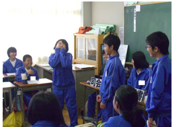
役割演技を活用した提案理由の説明

○今年度、初めて学級担任をしています。学級活動は学年で統一したことをやることが多く、学級会を見る機会があまりありませんでした。本日のような学級会をぜひやってみたくて強く思いました。特別活動について、さらに勉強をしていきたいです。