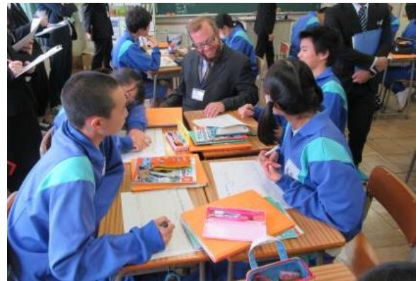
自分の考えを伝え合い、よりよい表現に変えていく