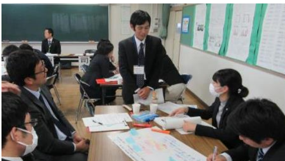
授業者への質問が、協議をさらに深める