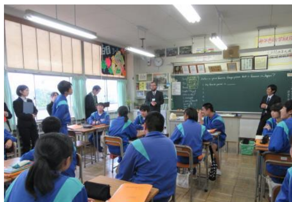
その場で思考・判断し、即興で考えを英語で伝える