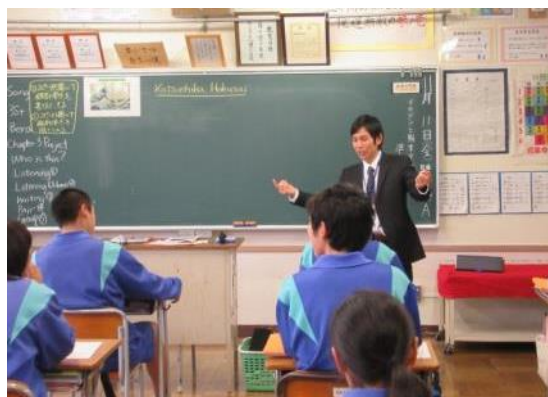
生徒との豊富な英語のやりとり

Chapter 3 Project 大切な人についてスピーチしよう (Total English Book3)