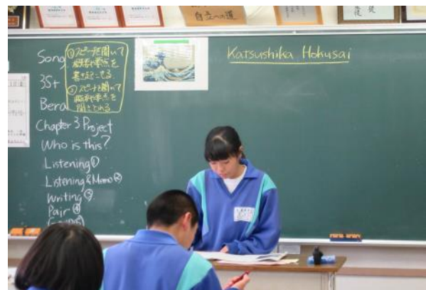
発表を聴き、友達のよさや自分の考えとの違いに気付く