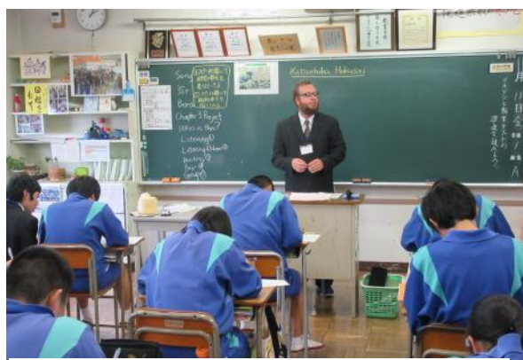
ALT からの情報のメモをとる