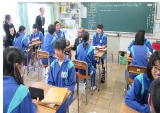
親和的な人間関係を土台とした言語活動