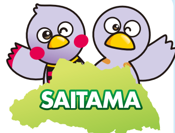
さいたまっち コバトン