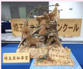
小学生低学年の部