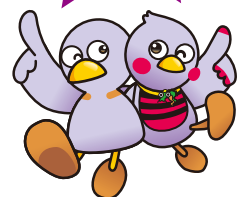
コバトン さいたまっち