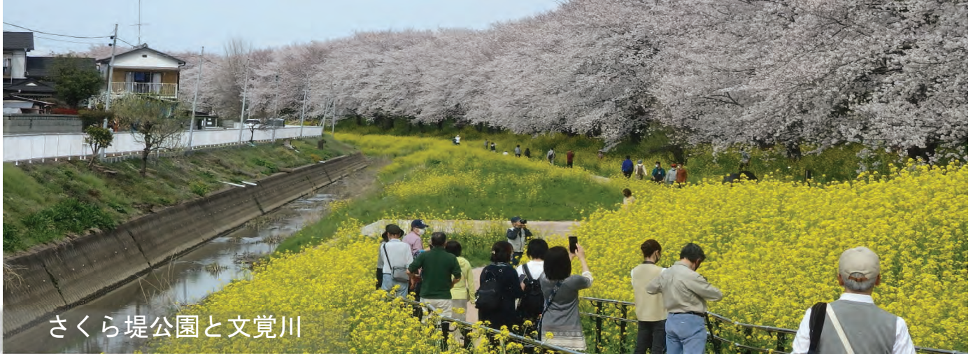
さくら堤公園と文覚川