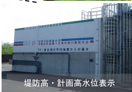
堤防高・計画高水位表示