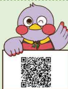
埼玉県マスコット「さいたまっち」