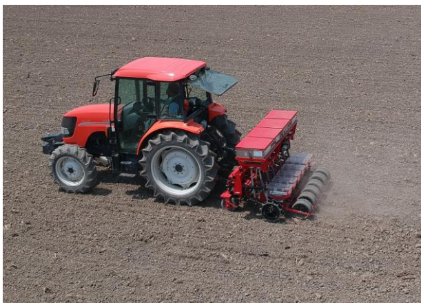
5~8km/h の高速播種作業 高精度播種で、良好な苗立ち！