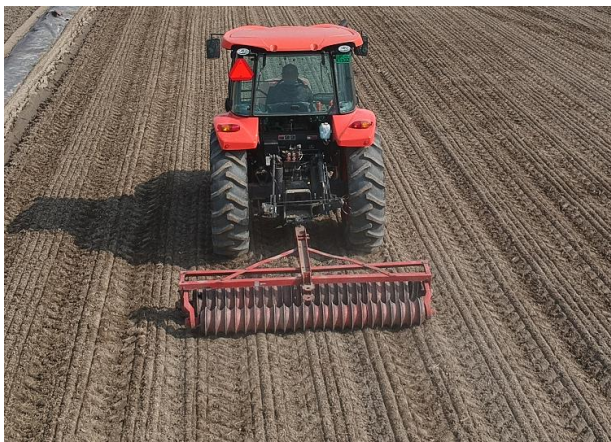
播種前の鎮圧作業 土塊を圧密して、漏水防止！

水稲作では、手作業の多い育苗が規模拡大の足かせとなっています。このため、育苗を行わない乾田直播栽培は規模拡大に重要な技術と考えられます。しかし、苗立ち不良や漏水によって肥料や除草剤の効きが悪い等、栽培が不安定なため導入を躊躇する生産者も多くみられます。そこで、鎮圧による漏水防止技術、直播にも適性の高い「彩のきずな」、高精度高速汎用播種機を組み合わせ、安定生産可能な乾田直播栽培技術を開発しました。これらの研究成果を取りまとめ、「鎮圧による漏水防止技術を導入した乾田直播「彩のきずな」栽培指針」を作成しました。