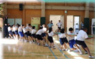
力いっぱい!力を合わせて!▲ 職員さんもがんばります▶