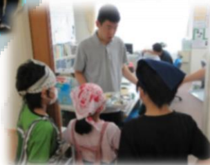
▲料理をふるまう喜び