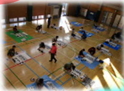
◀心を鎮めて書初め競書会