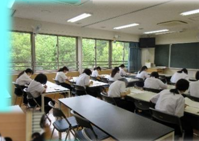
▲検定の合格めぎして