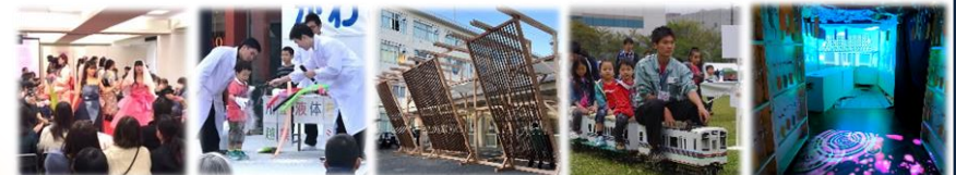
[デザイン科] アパレルショー