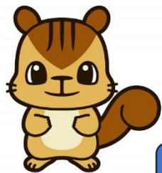
学校マスコット かわりすくん