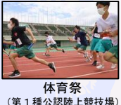
体育祭 (第1種公認陸上競技場)