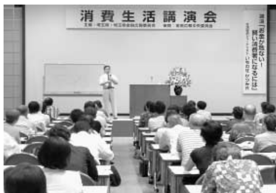
消費生活講演会 (消費生活支援センター主催)