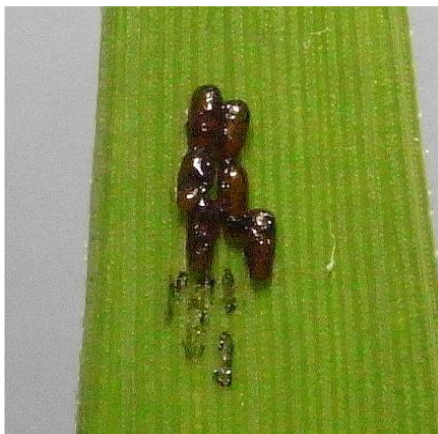
写真 2 イネの葉に産卵