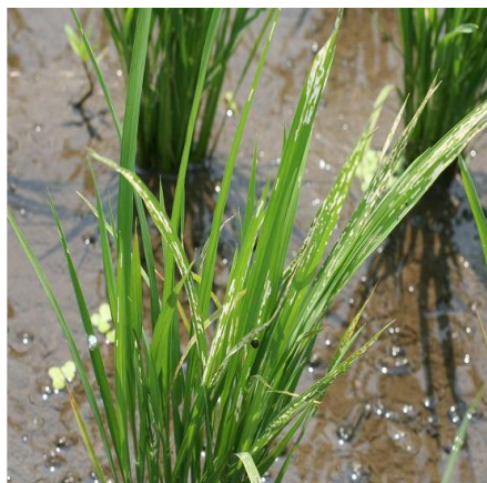
写真 6 被害株