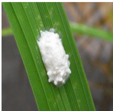
写真 4 イネの葉に形成された繭