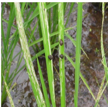
写真 5 幼虫と食害痕