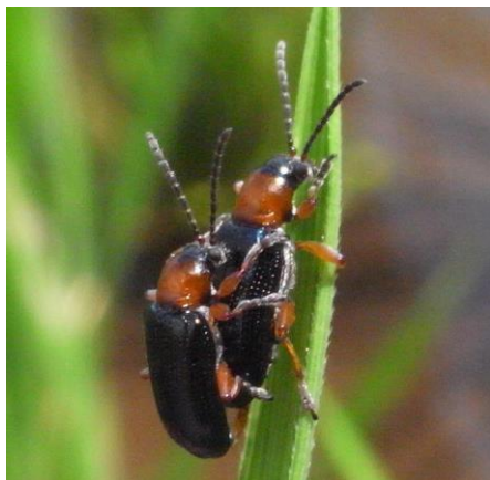
写真 1 成虫