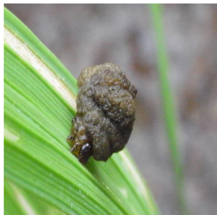
写真 3 糞を背負う幼虫