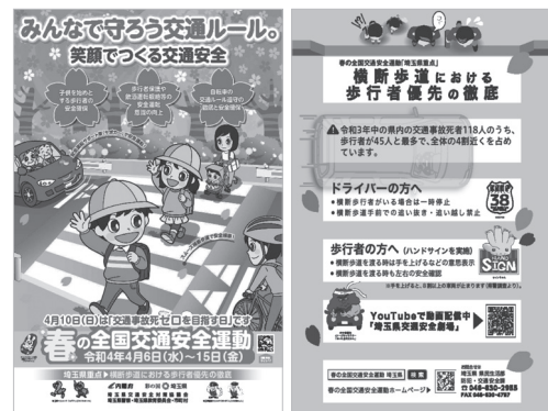
▲春の全国交通安全運動チラシ