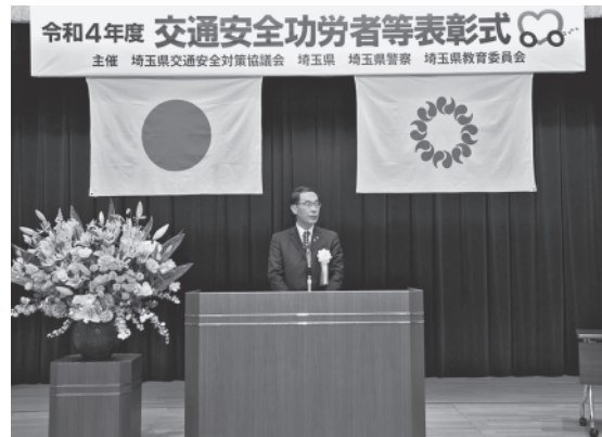
昨年度の状況 (令和4年度 交通安全功労者等表彰式)

埼玉県県民健康センター 大ホール 〒330-0062 埼玉県さいたま市浦和区仲町3丁目5-1