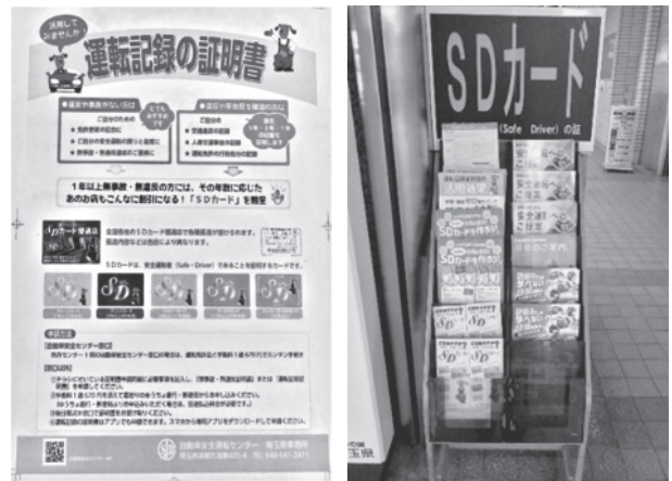
《啓発用チラシとパンフレットの配布》

鴻巣市内の運転免許センターの1階、免許更新受付コーナーにおいて、更新者に対し午前・午後の受付時前にチラシを配布、さらに、運転免許試験受付コーナーに、SDカード申請のチラシや安全運転中央研修所利用促進のパンフレットを配布し、更新者及び受験者の交通事故防止意識の向上を目指すとともに運転経歴証明書の活用を促進する活動を行っています。