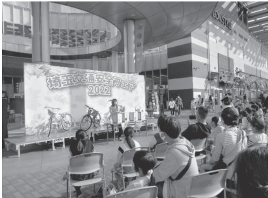
昨年度の状況 (埼玉交通安全フェア2022)

イオンレイクタウンmori 〒343-0828 埼玉県越谷市レイクタウン3丁目1番地1