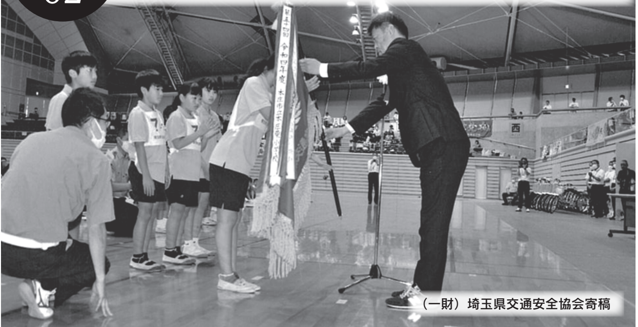
(一財) 埼玉県交通安全協会寄稿