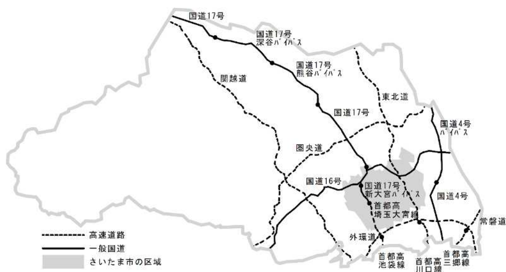
図2 九都県市による連携路線（県内）

義務付け路線を閉塞するおそれのある建築物（要安全確認計画記載建築物）の所有者が、所管行政庁に対して耐震診断結果を報告する期限を令和4年3月末までとして報告を義務付け、耐震改修促進法第9条の規定に基づき、所管行政庁である県及び4市は耐震診断結果を公表している。