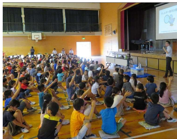
学校や職場にも出前します