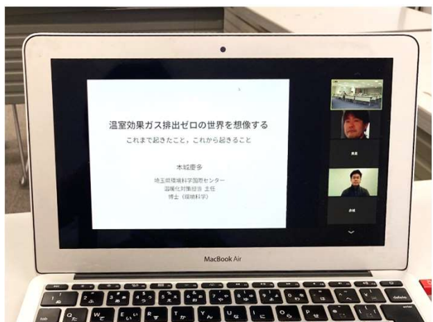
オンラインでの開催も ※担当課にご相談ください

埼玉県が取り組む事業や施策 を県職員が説明します。 集会や団体の会議、学校の授 業などにご活用ください。