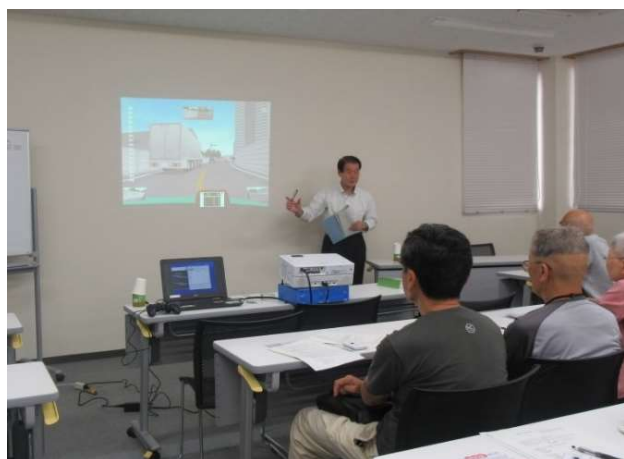
PTA や地域での勉強会などに