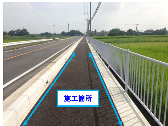
ポーソーシールT施工場所

<施工年度> 平成25年度 <施工場所> 主要地方道加須北川辺線 <発注機関> 埼玉県行田県土整備事務所