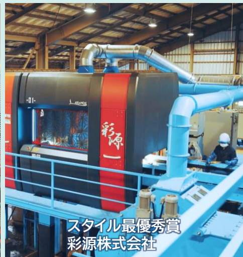
スタイル最優秀賞 彩源株式会社