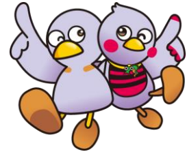
埼玉県マスコット 「コバトン」「さいたまっち」

3S運動を実践している産業廃棄物処理業者の皆様にご登録いただき、それぞれの取組を通じて、3S運動を盛り上げていくものです。簡単に登録できますので、是非、御参加ください。