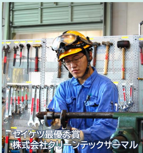
セイケツ最優秀賞 株式会社クリーンテックサマル