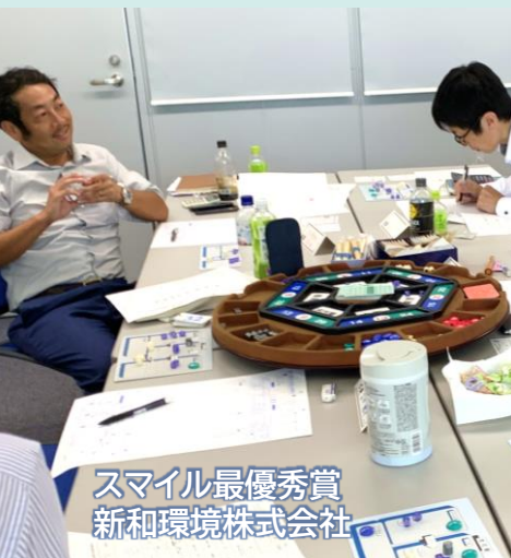
スマイル最優秀賞 新和环境株式会社