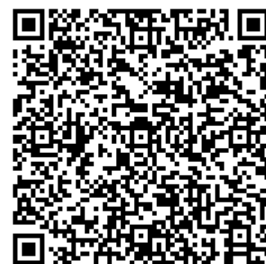
埼玉県HP 「3S運動推進事業者」 登録のすすめ