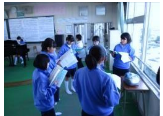
混声四部合唱曲「川」の 音取りを中心としたパート練習