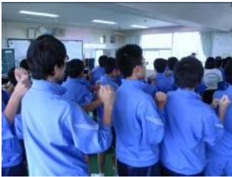
心をほぐすウォーミングアップ