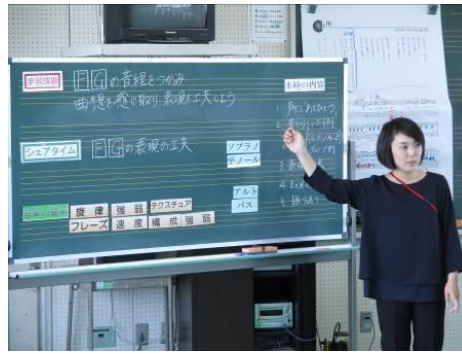
本時の課題を確認する