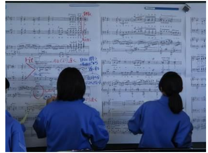
グループの考えは 付箋に書いて全体で共有