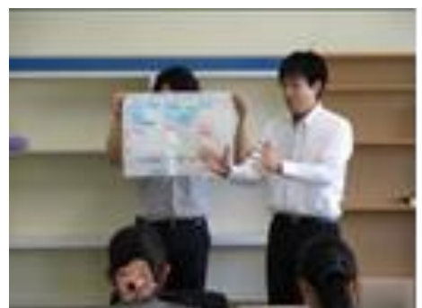
グループ協議や発表