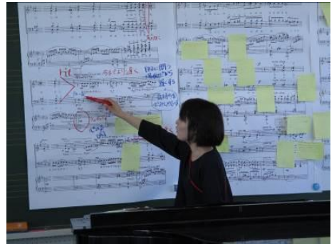
全体で歌い方を統一