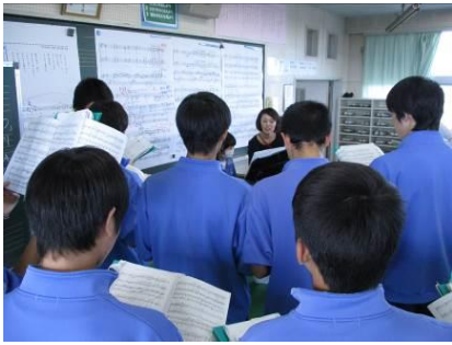
パート練習の課題 に対する指導