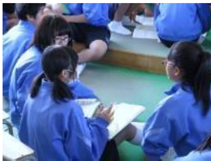
小グループでシェアタイム