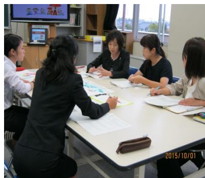
活発な研究協議会の様子