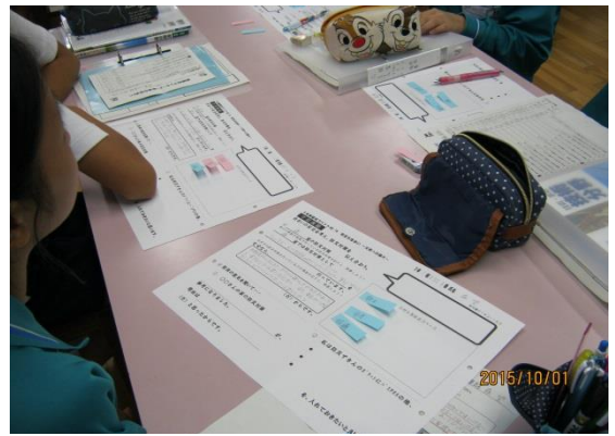
グループで我が家の防災対策を伝え合い付箋で交流（青…同じ、赤…新たな対策）

○保護者や地域との連携を図っていて素晴らしいなあと感じました。子供たちの役割分担がきちんとされていてスムーズに活動が出来る事、授業者の指示が明確で分かりやすく子供たちがすぐ反応していた事が印象的でした。何より、授業者や指導者のお話からいろいろな情報や指導技術を学ぶことができたことがよかったです。