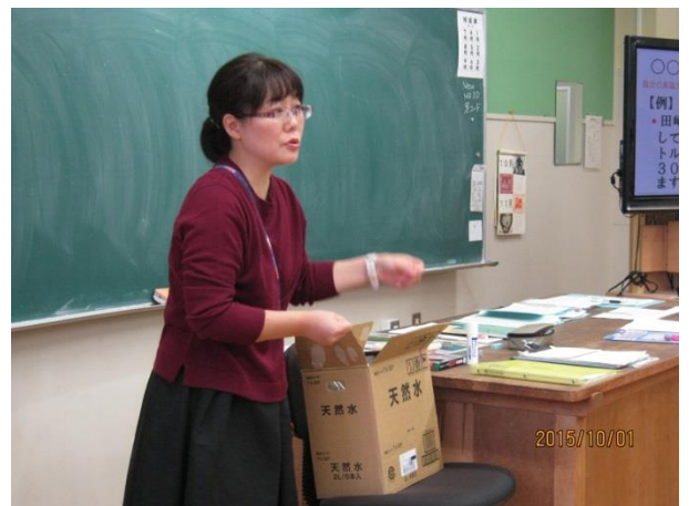
教師の防災対策を例示した見通し