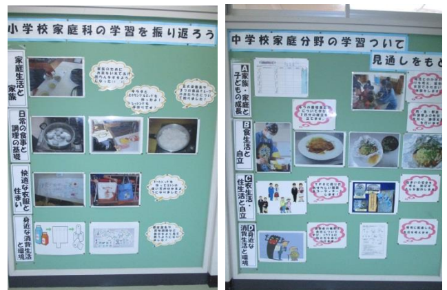
小中連携を意識した家庭科室の掲示