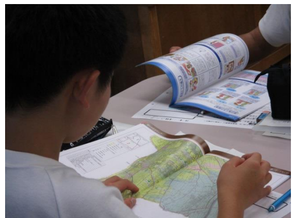
「吉川市防災マップ」から正確な情報を