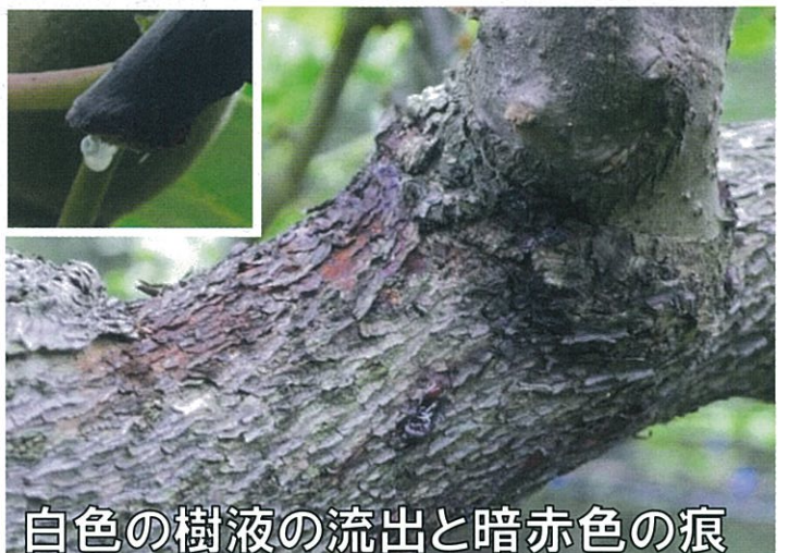
白色の樹液の流出と暗赤色の痕