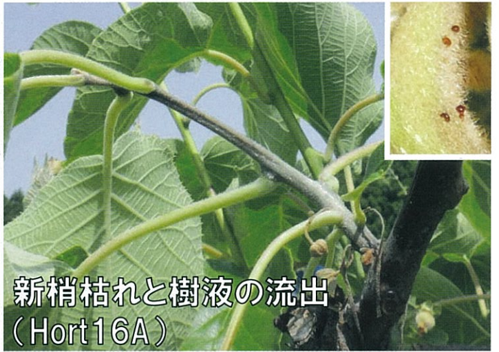
新梢枯れと樹液の流出 (Hort16A)