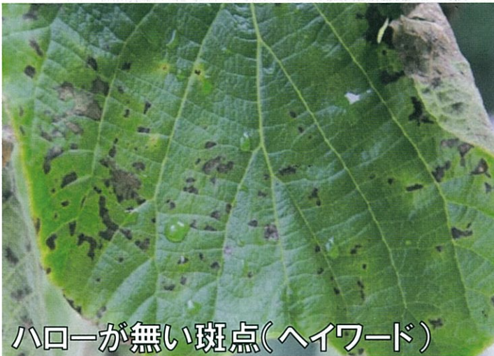
ハローが無い斑点(ハイワード)