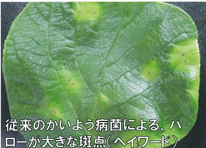
従来のかいよう病菌による、ハ ローが大きな斑点(ハイワード)