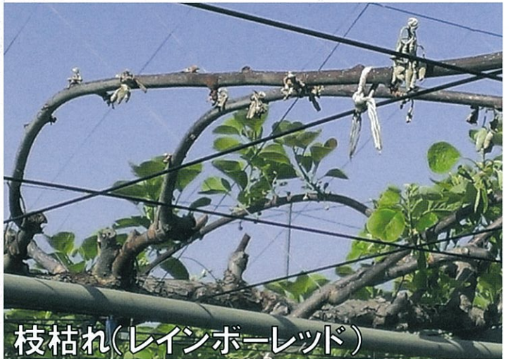
枝枯れ(レインボーレッド)