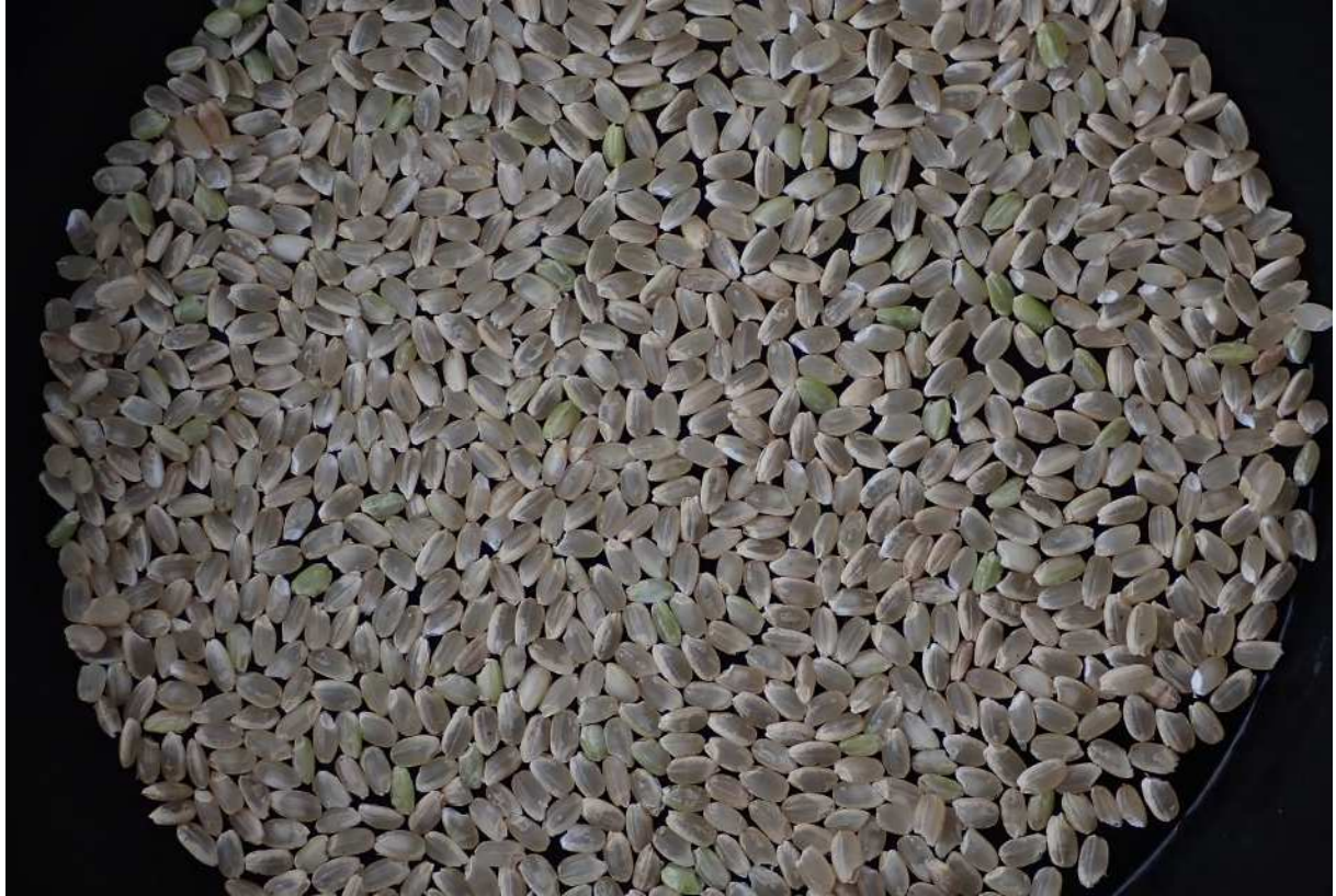
○5月1日植コシヒカリ、出穂後34日（8月22日）の玄米（篩目1.8mm）