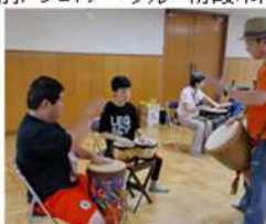
出前ドラムサークル 朝霞市内