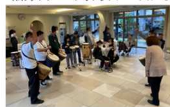
(株)リゾン パブリックスペースにて