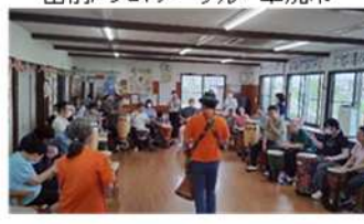
出前ドラムサークル 草加市