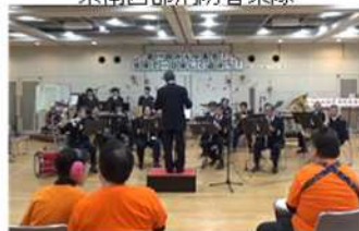
県南西部消防音楽隊