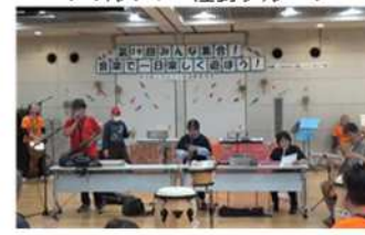
ウォルフィー 佐野グループ