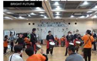
ブライトフューチャー