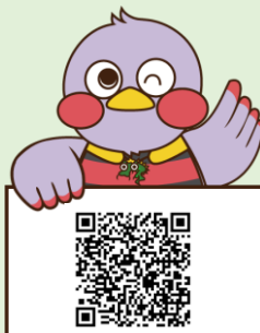
埼玉県マスコット「さいたまっち」