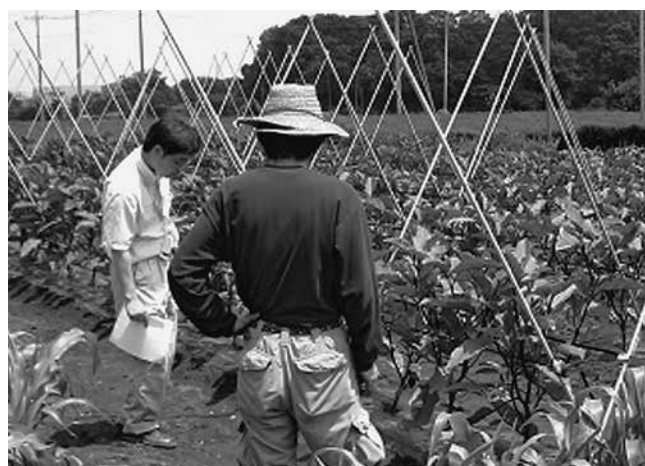
研修ほ場巡回指導

現在、16名の塾生が7市町で研修を行っています。特徴は塾が研修農地を準備することです。研修は1人約30アールの農地で行い、卒業後はそのまま農地を引き継ぎ就農することができます。遊休農地対策にも貢献しています。研修農地や作業場、中古機械等の確保に皆さんの協力をお願いします。