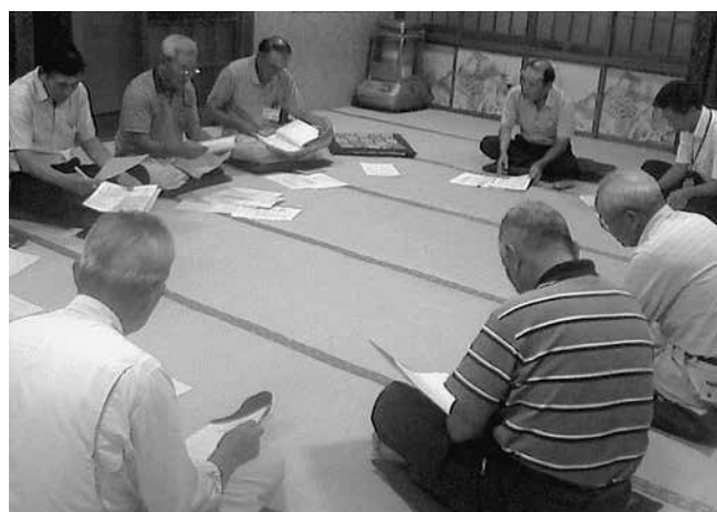
法人化設立に向けた行政書士による研修会 農事組合法人沼端（H26.12設立）

個人経営だけでなく、集落営農や作業受託集団などの組織に対しても、研修会等実施しています。法人化を検討される方、個別相談を希望される方はお問い合わせください。