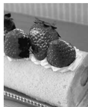
いちごのロールケーキ

6次産業化に対するご相談がありましたら、川越農林振興センター農業支援部までお問い合わせください。