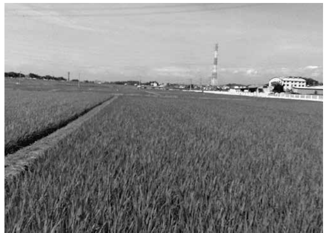
下小坂地区の水田（現況）

ほ場整備事業が行われた後は、地域の担い手等により、大規模で効率的な農業が営まれていく予定です。