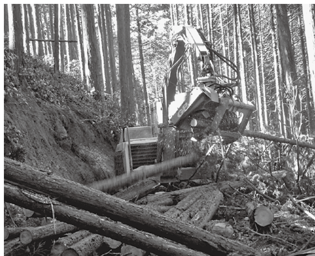
作業路でヒノキを玉切る高性能機械「プロセッサ」

森林所有者の多くは、森林経営に関心がなくなり山離れも進み、隣接する森林との境界が分からない方が増加していることから、林業担い手の新規参入や境界確認作業も支援しながら、森林の循環利用を推進していきます。