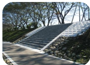
既存市道を活用した歩行者動線