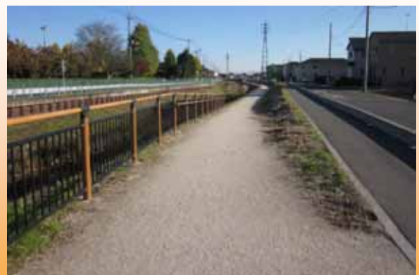
現在の自然環境を保全しつつ、地域の方々が利用しやすい水辺となった。（H24.11撮影）