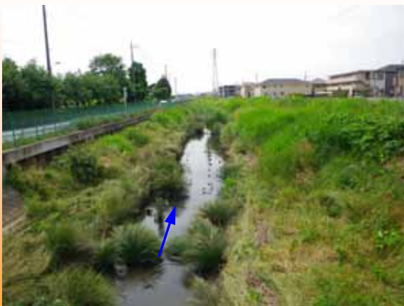
水辺に安全に近づける場所がない。（H22.6撮影）