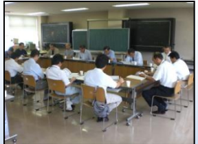
「浮きウキフェスタ」イベント開催