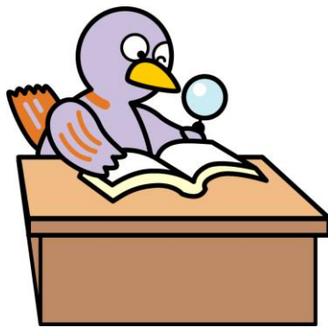
埼玉県のマスコット コバトン