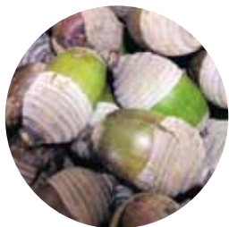
⑤シラカシ ( )

どんぐりは形、色、もようなどさまざま。 かぶっているぼうしもいろいろあって おもしろいね。