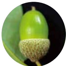
①コナラ ( )