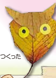
葉っぱでつくった フクロウ