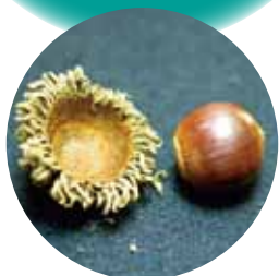
②クヌギ ( )