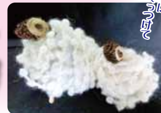
まっぼっくりのひつじ