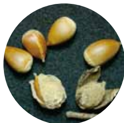
③スダジイ ( )