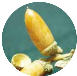
④マテバシイ ( )