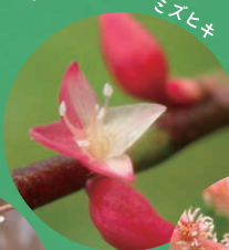
あんな形やこんな色