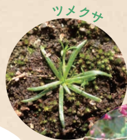
ようこん 葉痕や実も魅力的