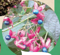
クサギ独特の葉のにおい 実の色