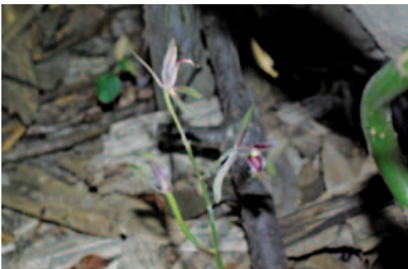
1703 マヤラン (P.207)