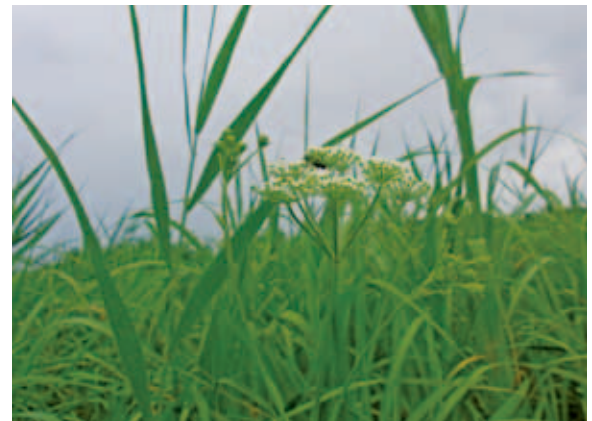
1330 シムラニンジン (P.132)