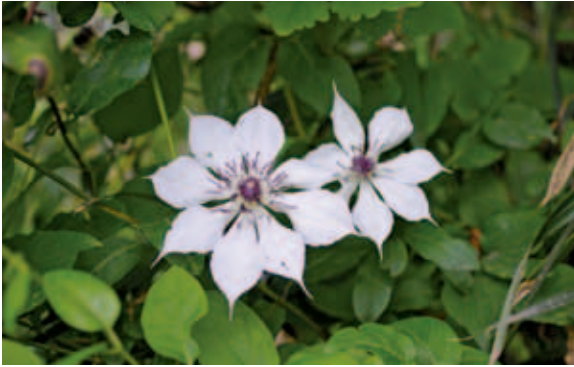
1171 カザグルマ (P.101)