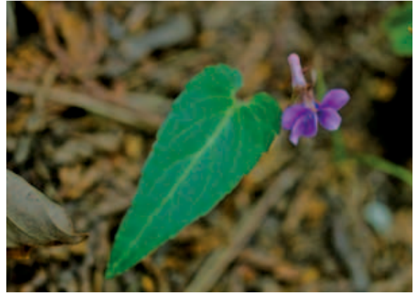
1301 マキノスマレ (P.127)