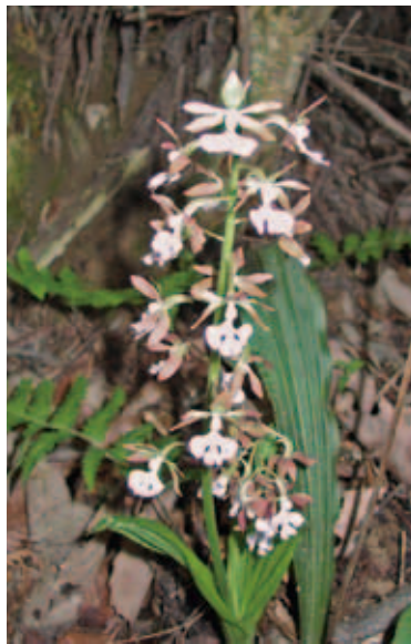
1691 エビネ (P.205)