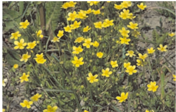
1183 ヒキノカサ (P.103)