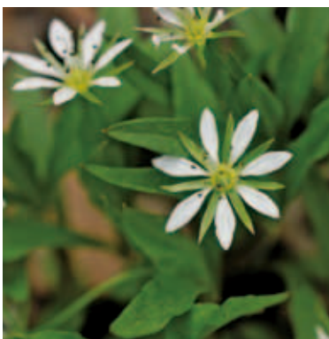
1146 ヒゲネワチガイソウ (P.96)