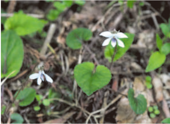
1294 コミヤマスマレ (P.125)