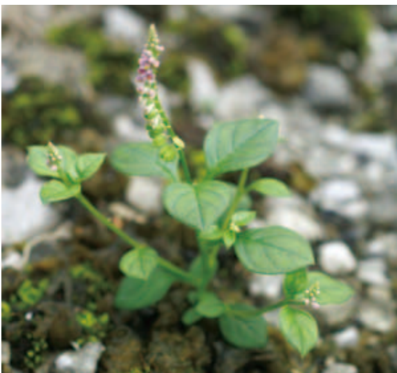
1279 ヒナノキンチャク (P.122)