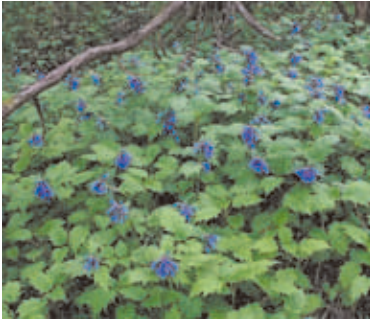
1409 ヒイラギソウ (P.148)