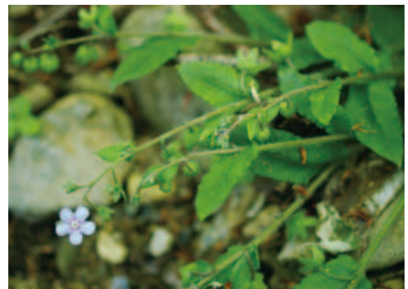
1402 ヤマルリソウ (P.147)