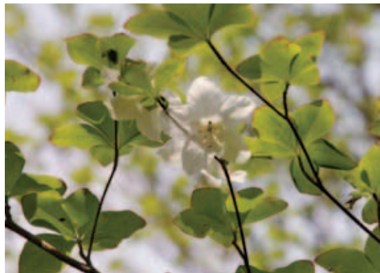
1353 シロヤシオ (P.137)