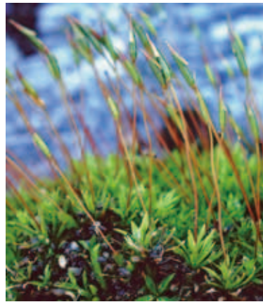
2026 センボンウリゴケ (P.247)