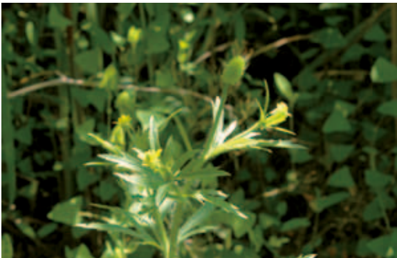
1179 コキツネノボタン (P.102)