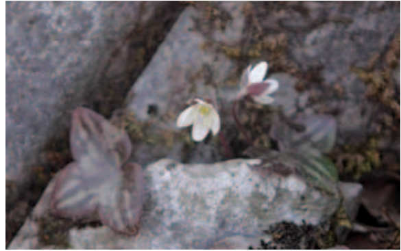
1177 ミスミソウ (P.102)