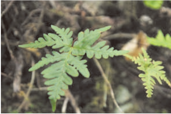
1035 ヒメウラジロ (P.73)