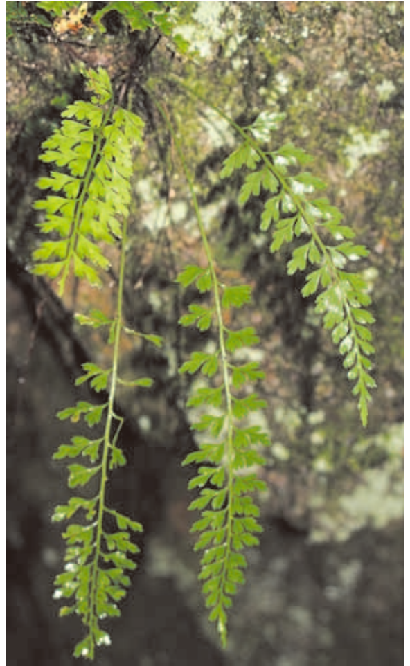
1047 オクタマシダ (P.76)