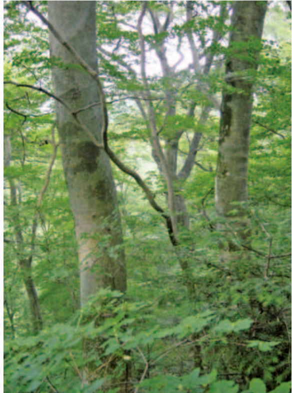
埼玉県では最下限の標高に残る壮大なブナ林（飯能市） (P.323)