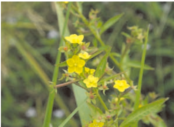
1314 ウスゲチョウジタデ (P.129)