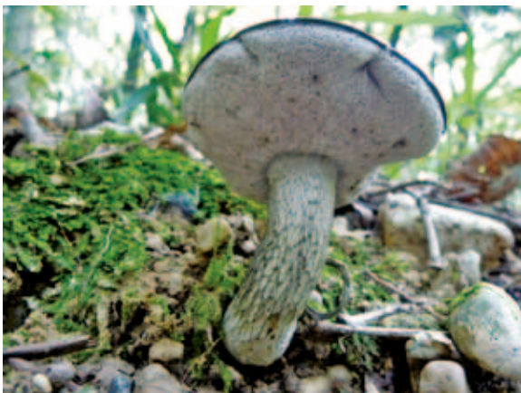
5026 モエギアミアシイグチ (P.298)