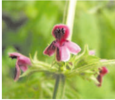
1415 マネキグサ (P.149)