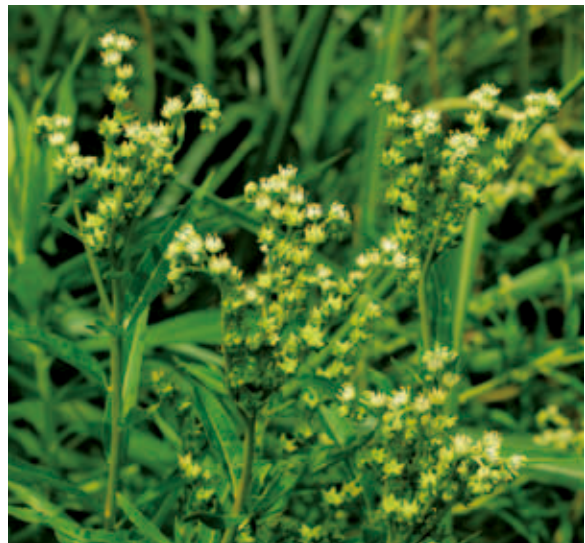
1237 タコノアシ (P.114)