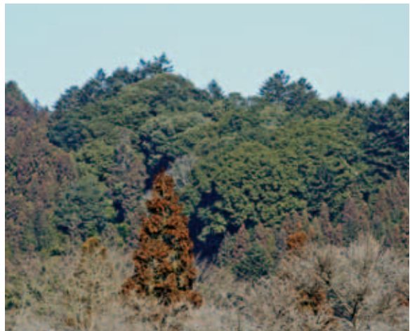
モミを伴いウラジロガンとツクバネガンが優占するカン型林（飯能市） (P.309,312)