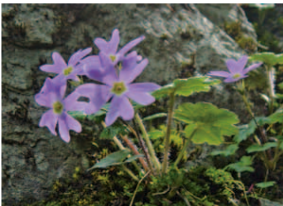
1365 コイワザクラ (P.139)