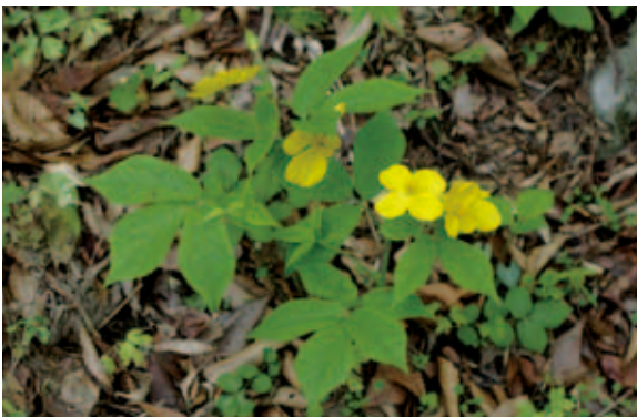
1216 ヤマブキソウ (P.110)