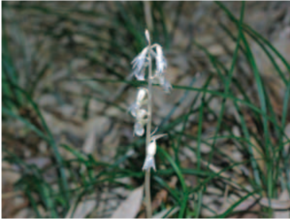
1716 タシロラン (P.210)