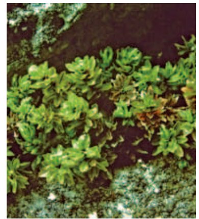
2029 シナノセンボンゴケ (P.247)