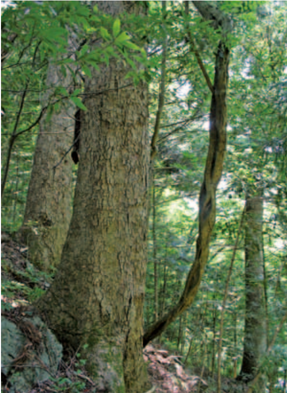
中間温帯域を特徴づける典型的なモミ林（小鹿野町） (P.316)