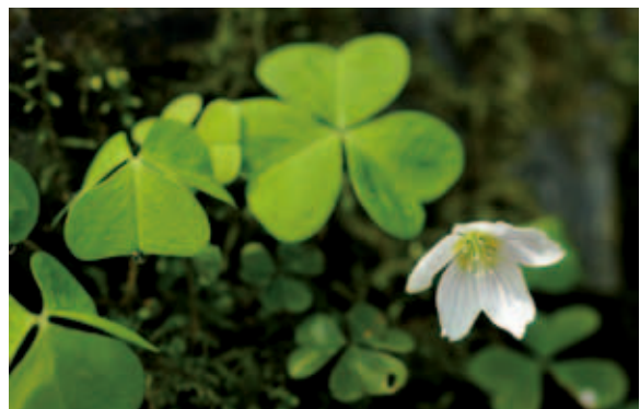
1267 コミヤマカタバミ (P.120)