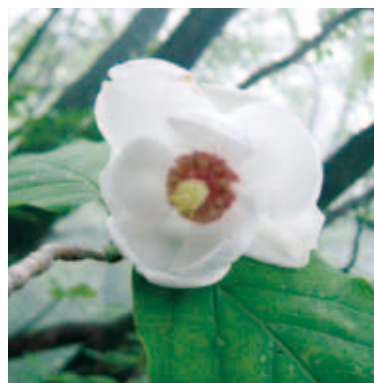
1155 オオヤマレンゲ (P.97)