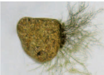
3005 イシカワモズク (P.268)