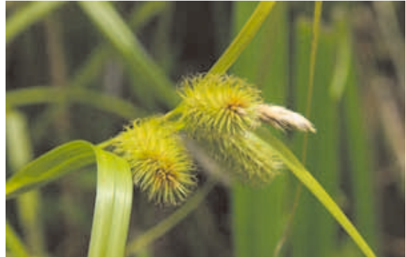
1651 ジョウロウスゲ (P.197)