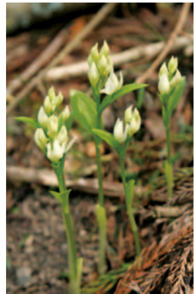
1696 ユウシュンラン (P.206)