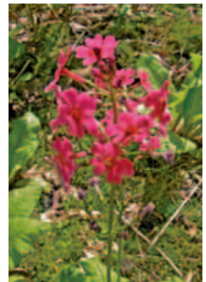
1364 クリンソウ (P.139)