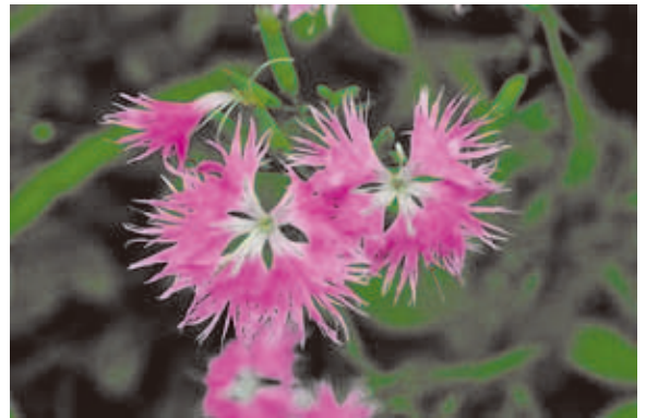
1142 カワラナデシコ (P.95)