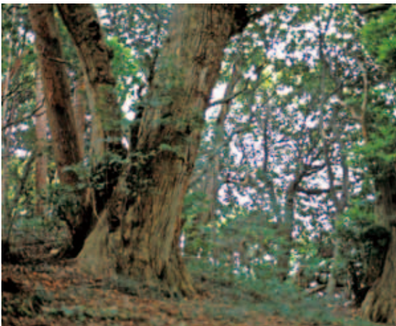
集団として残存するスダジイの巨木林（小川町） (P.310)