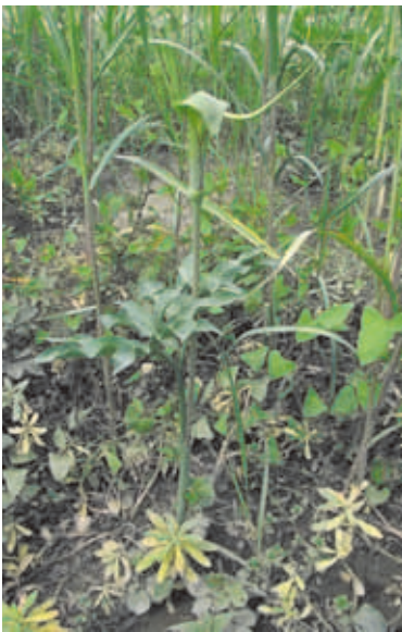
1634 マイヅルテンナンショウ (P.193)