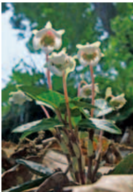
1337 ウメガサソウ (P.134)