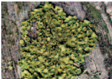
4026 クロカワアワビゴケ (P.283)