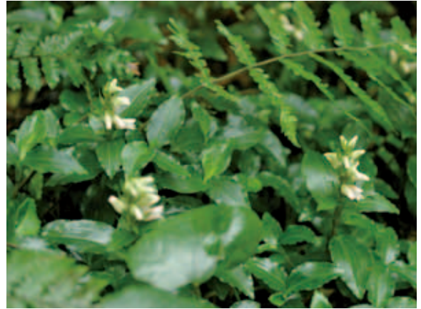
1722 アケボノシュスラン (P.211)