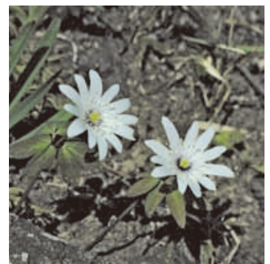
1166 アズマイチゲ (P.100)