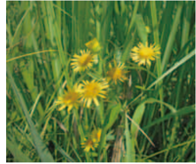
1505 ホソバオグルマ (P.167)