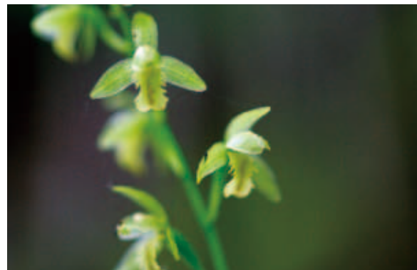
1711 ハコネラン (P.209)