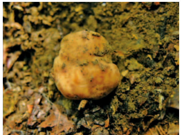
5045 クルミタケ (P.301)