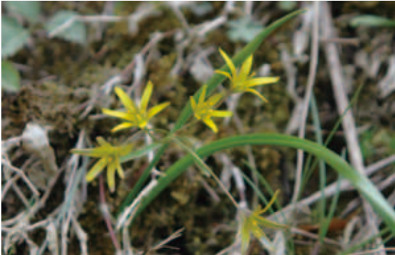
1572 キバナノアマナ (P.181)