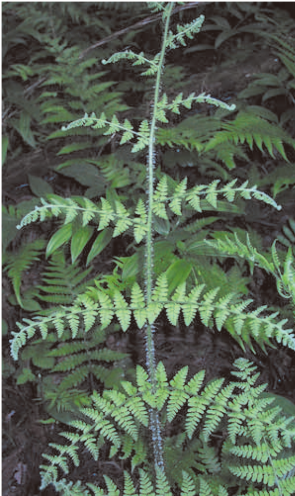
1058 キヨスミヒメワラビ (P.78)