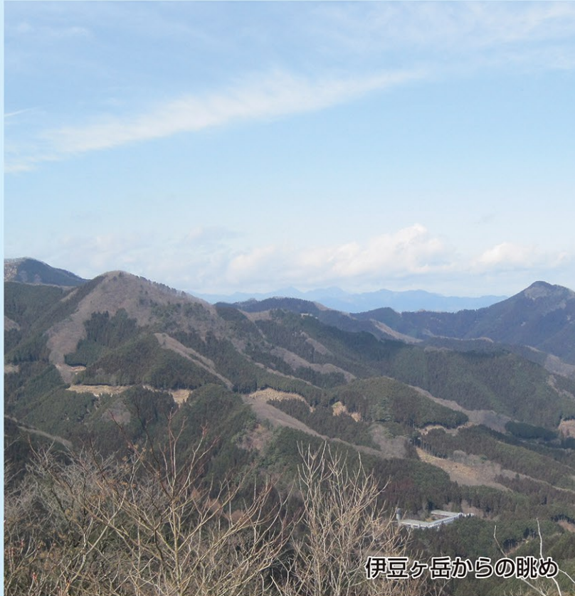
伊豆ヶ岳からの眺め