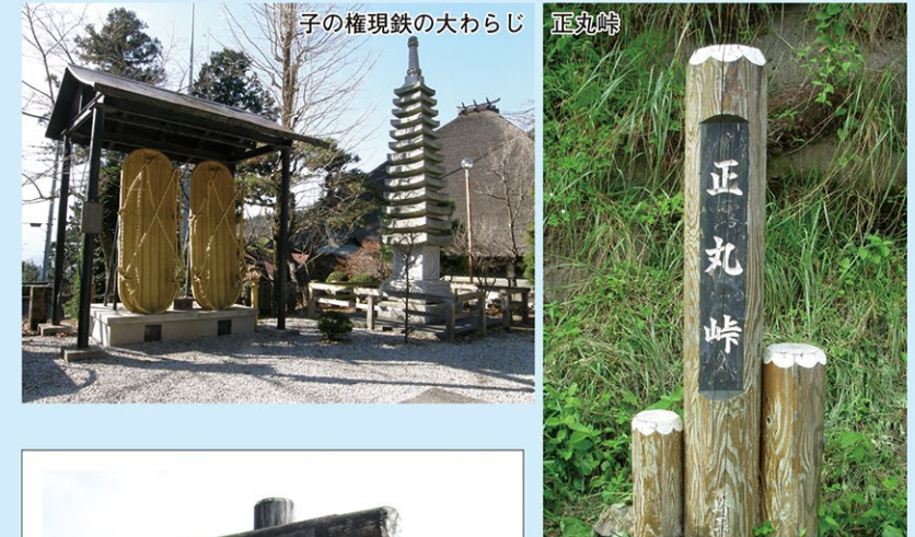
子の権現鉄の大わらじ