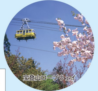
宝登山ロープウェイ

※宝登山山頂奥社鳥居は、この他にも近くに石製の鳥居があり、その鳥居で撮影した写真でも、踏破ポイントとして認定されます。