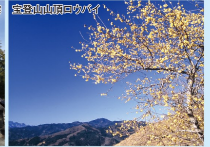
宝登山山頂ロウバイ