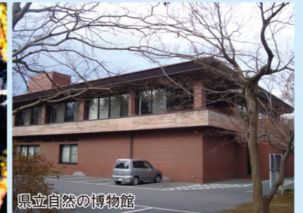
県立自然の博物館