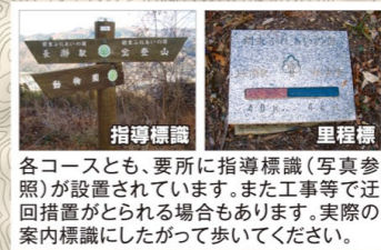
各コースとも、要所に指導標識(写真参照)が設置されています。また工事等で迂回措置がとられる場合もあります。実際の案内標識にしたがって歩いてください。