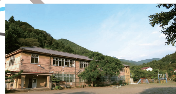
あしがくぼ笑楽校(旧芦ヶ久保小学校)