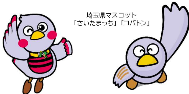
埼玉県マスコット 「さいたまっち」「コバトン」