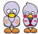
埼玉県マスコット 「コバトン」「さいたまっち」