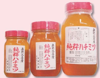
はちみつ ¥1,250～ (税込) 地元の養蜂所で採れた 純粋ハチミツです