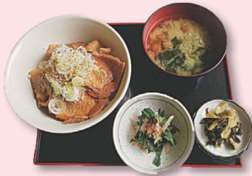
豚みそ丼 ¥980 (税込)