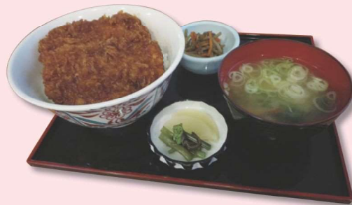
あらじかつ丼 ¥1,000 (税込)