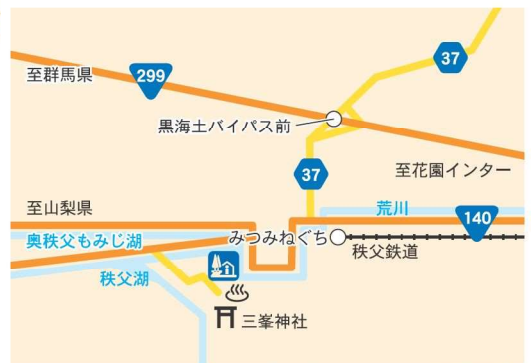
道の駅 大滝温泉 検索

定休日 【農産物直売所 (物産館)、温泉施設等 (遊湯館)】 木曜日 【食堂 (レストラン)】 郷路館 木曜日 【コンビニエンスストア】 無休