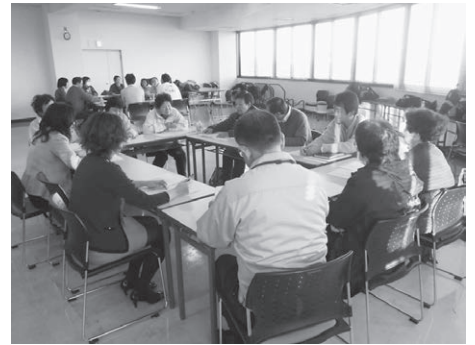
(ロードサポート交流会の様子)