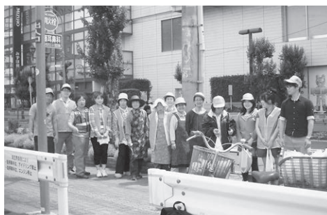
〔所沢市東住吉花の会の活動風景〕