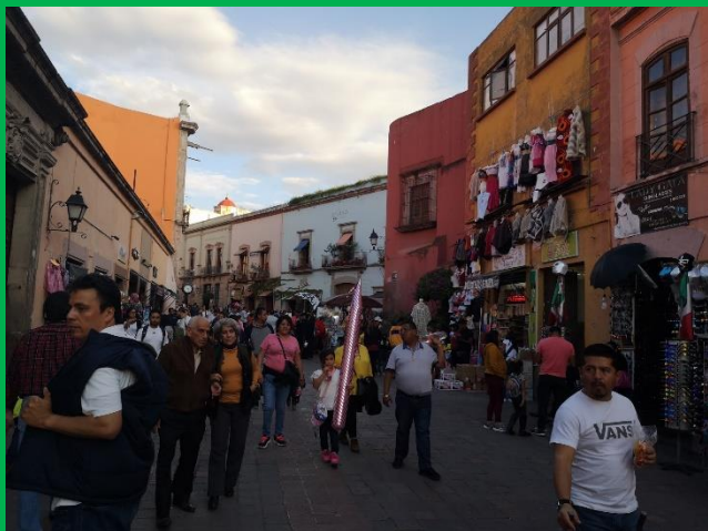
(ケレタロの歴史地区)