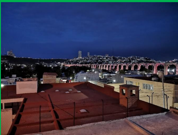
(ケレタロの水道橋)

その中でも、ケレタロ州はメキシコシティから車で約3時間、グアナファト州まで約1時間と立地的な優位性が高い州であり、多くの外資系企業が進出しております。また年間を通しての温暖な気候、安定した治安、物価の安さなどの利点から、メキシコ人の友人からケレタロで暮らしたいという声を聞くことも珍しくありません。まず、ケレタロについて近代的なバスターミナルに驚きました。そして、バスターミナル周辺は建設中の外資系ホテルが多くあり、ケレタロの街がこれからさらに発展していくことが目に見えてわかりました。また、ケレタロの中心部の歴史地区は世界遺産にも登録されており、コロニアル様式の建物が非常に美しかったです。歴史地区は小さくまとまっているため、1日もあれば余裕で見て回ることができます。そして、ケレタロの街のシンボルは全長1280mにも及ぶ水道橋です。私は夜に展望台へ見に行ったのですが、ライトアップされた水道橋は壮観でした。また、中心部から10kmほどの所に大規模なショッピングモールもあり、ケレタロの暮らしやすさを感じ取ることができました。