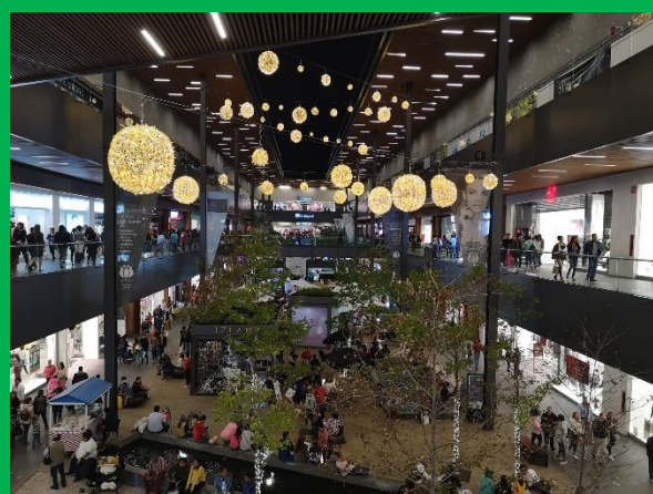
(ショッピングモール)