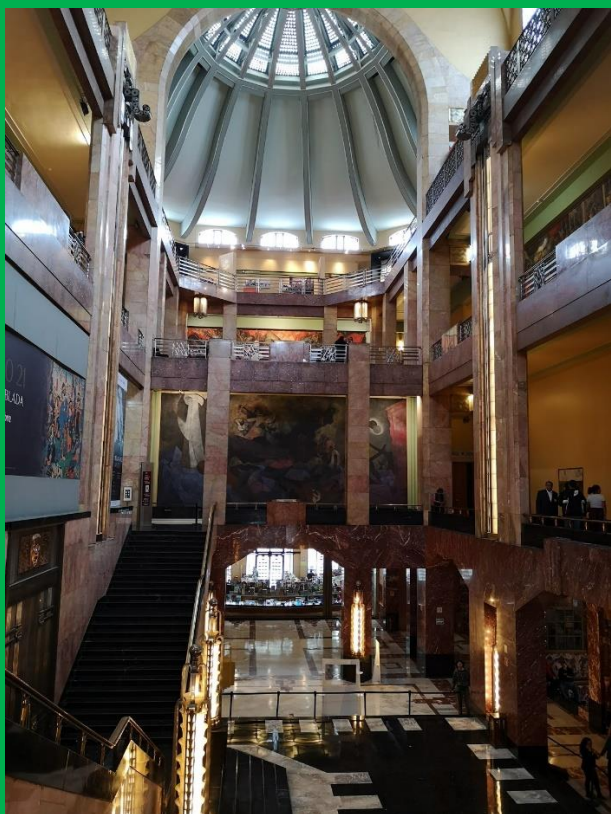
(豪華な Bellas Artes の内装)