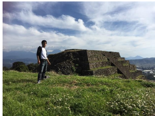
〔高原の遺跡と本人〕

蝶が生息する山岳に地帯にシラファト・サンフェリペという遺跡もあり、併せて見学をしてきました。高原に佇むピラミッドは雄大そのものでした。