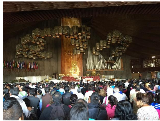
〔グアダルーペ寺院の外観と内観〕