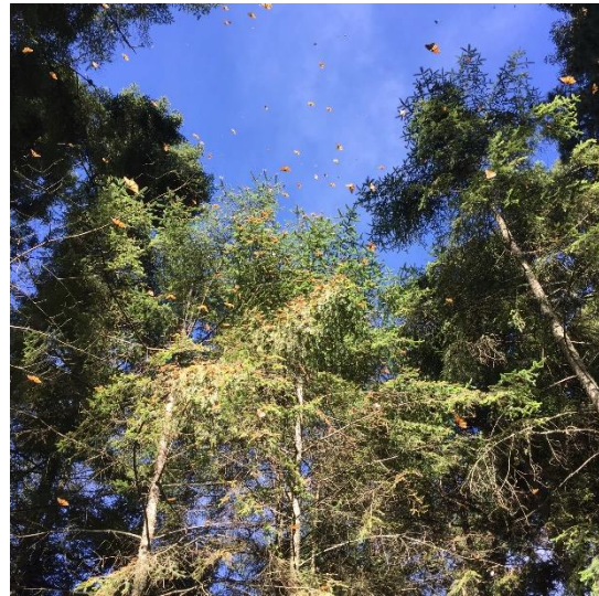
〔モナルカ蝶の群生〕

また、もう1つのモレリアへの目的はマリボサ・モナルカと言う蝶を観に行く事でした。モナルカ蝶はカナダとメキシコの間を数ヶ月かけて横断し、子々孫々とその営みを繰り返すことで有名な蝶です。モナルカ蝶は3000mを超える山脈にしか棲息していないのですが、登山の末に出会えたオレンジ色に輝く蝶の群生はまさに圧巻、数百万匹は居るであろう蝶たちが自分の周りを飛ぶ姿は忘れられない光景となりました。