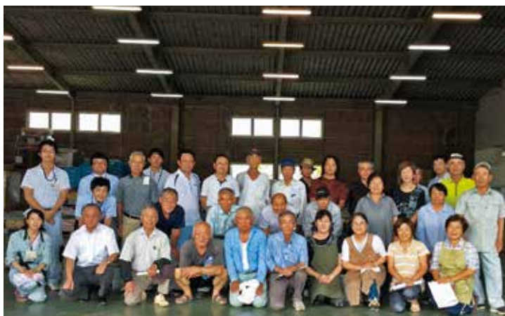
川島町いちじく生産組合の皆さん