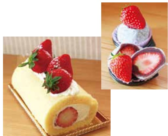
苺の里オリジナル商品 いちごロールケーキといちご大福