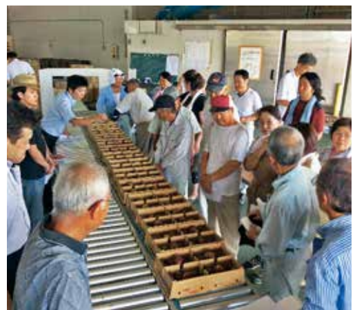
いちじくの出荷物の目揃い会