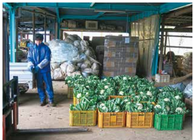
就農した元研修生による集荷風景