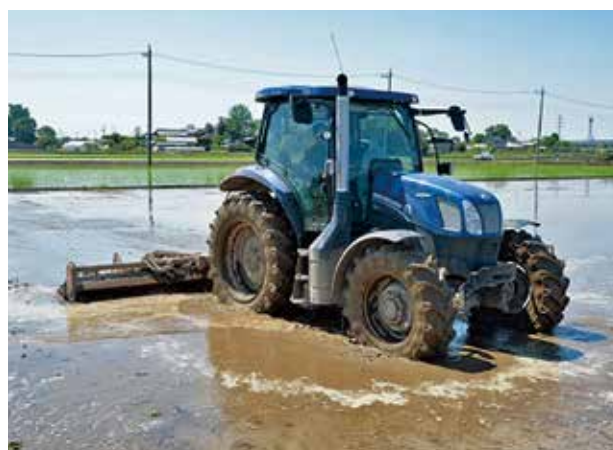
GPSを搭載したトラクタ (水田の代かき風景)